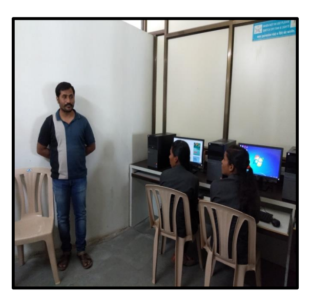
► Guest Lecture on How to develop research attitude and latest trends in the field of research (Date: 12<sup>th</sup> October 2019)