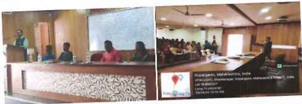
Some memorable events/photographs during the conference